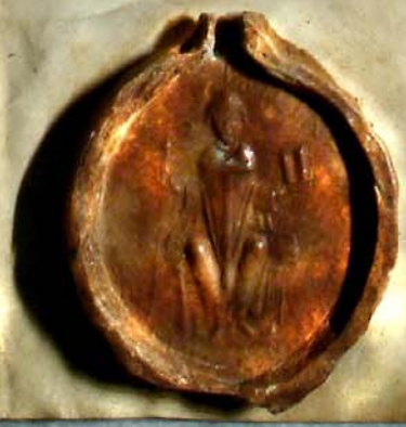
Weiheurkunde, Staatsarchiv Darmstadt, A 3 Nr. 331.

Acta sunt hec Anno Incarn. M. C. xxviii. Indict. vii. Idibus xxviii. Concijs. i.